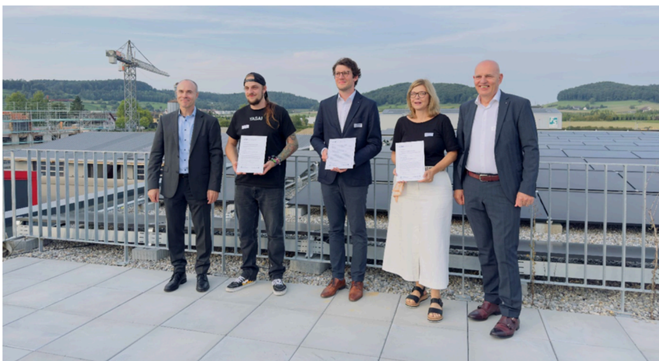
Bild: Gewinnerinnen und Gewinner Innovationspreis ZüriUnterland 2025

Mit dem Ziel, Innovationen aus dem Unterland sichtbar zu machen und zu würdigen, wurde bereits zum fünften Mal in Folge der vom Wirtschaftsrat lancierte Innovationspreis Zürcher Unterland vergeben. Der Wirtschaftsrat, welcher als Jury fungiert, freute sich auch dieses Jahr, die ausgesprochen guten Bewerbungen zu prüfen.