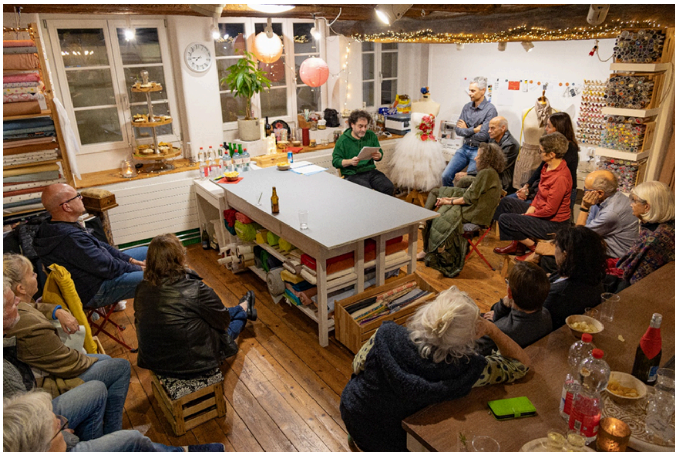
Bild: Literaturparcour «Fremdgehen» in der Bülacher Altstadt (Andrej Weiss)

Auch dieses Jahr fanden am 28. September 2025 Architekturführungen im Rahmen von Open House Zürich statt. In Dielsdorf und Regensberg erhielten Teilnehmende Einblick in ausgewählte zeitgenössische Wohnbauten sowie in die Renovation der St. Pauluskirche. Die Führungen ermöglichten einen direkten Austausch mit Fachpersonen und förderten das Verständnis für Baukultur und räumliche Qualität in der Region. Sie bieten zudem die Chance, über das in der Stadt Zürich bekannte Format «Open House», Menschen aus der Stadt ins Zürcher Unterland zu bringen.