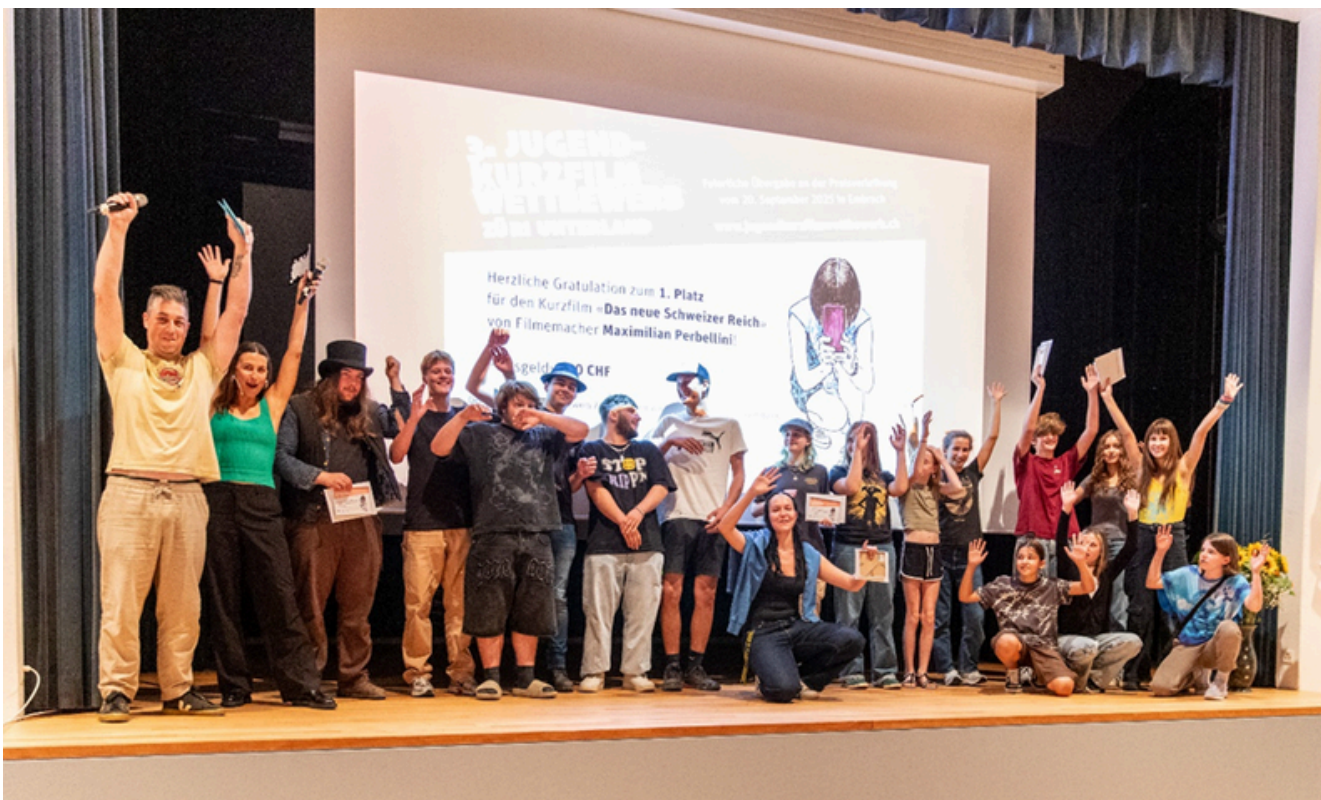
Bild: Gewinnerinnen und Gewinner des Jugendkurzfilmwettbewerbs 2025

2025 beteiligte sich ZüriUnterland erstmals am Jugendkurzfilmwettbewerb in Embrach, der zuvor zweimal auf lokaler Ebene durchgeführt worden war. ZüriUnterland übernahm insbesondere kommunikative Aufgaben sowie die Mitorganisation der Preisverleihung. Ziel war es, den Wettbewerb organisatorisch zu stärken und seine Reichweite behutsam zu erweitern. Am Wettbewerb 2025 nahmen sechs Filmteams mit insgesamt acht Kurzfilmen von Jugendlichen im Alter von 10 bis 18 Jahren teil. Die Preisverleihung fand im Gemeindehaussaal Embrach statt. Es freut uns sehr, dass der Wettbewerb die kulturelle Teilhabe junger Menschen stärkt und ihnen eine Plattform bietet, um ihre Perspektiven kreativ sichtbar zu machen.